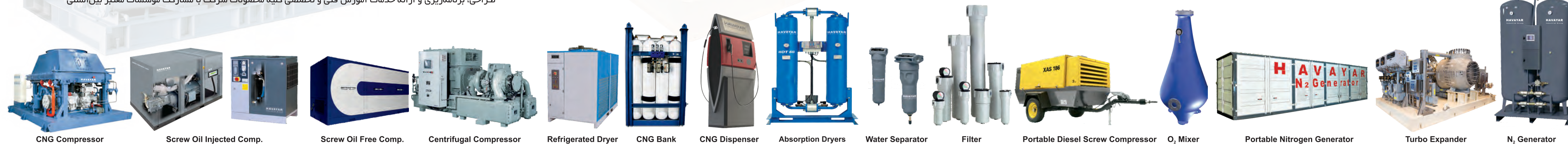
CNG Compressor Screw Oil Injected Comp. Screw Oil Free Comp. Centrifugal Compressor Refrigerated Dryer CNG Bank CNG Dispenser Absorption Dryers Water Separator Filter Portable Diesel Screw Compressor O 2 Mixer Portable Nitrogen Generator Turbo Expander N 2 Generator

طراحی، برنامه ریزی و ارائه خدمات آموزش فنی و تخصصی کلیه محصولات شرکت با مشارکت مؤسسات معتبر بین المللی